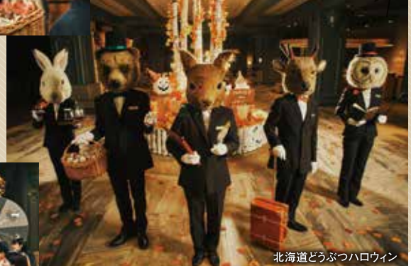
北海道どうぶつハロウィン