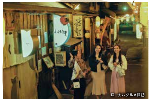
ローカルグルメ探訪