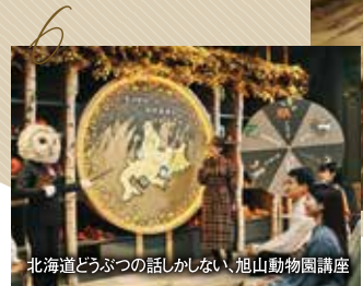
北海道どうぶつハロウィンの旭山動物園講座