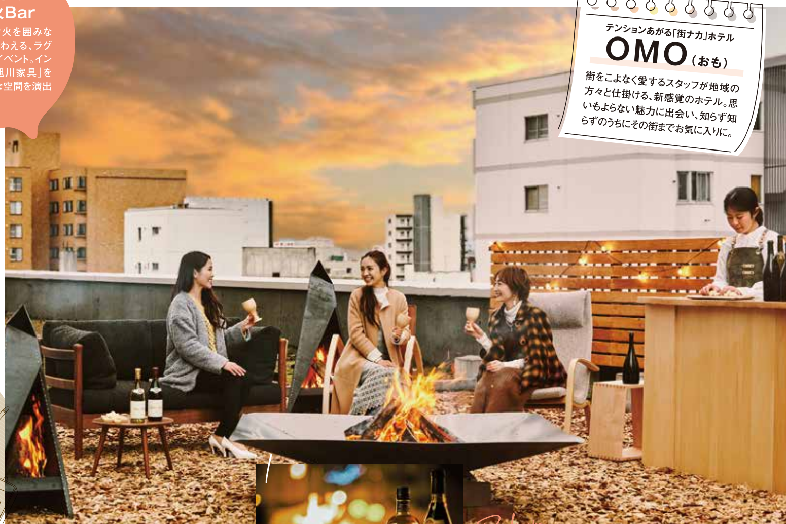
旭川まちなか焚き火Bar